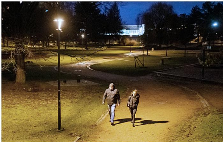
Některá města se snaží ušetřit na veřejném osvětlení.

Radnice reagují na zdražování energií – montují LED svítidla, plánují fotovoltaické elektrárny. V dohledné době jim totiž končí fixace cen. Velké problémy musejí řešit například v jihočeském Písku, kde pro letošní rok odhadují až dvaapůlkrát vyšší náklady oproti minulému roku