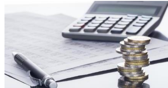
Investiční a provozní náklady