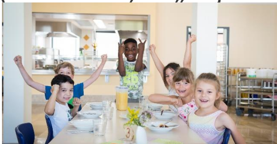
Rostoucí nároky: Zdravá výživa a rozmanitost

Feedback od našich zákazníků – co Vás zajímá a trápí? (ale také to, že „nejsou lidi“ i kvůli malým tabulkovým platům)