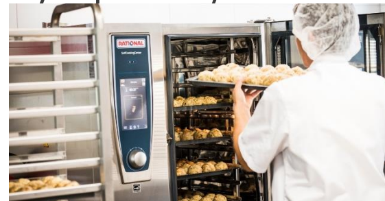
Efektivní a udržitelná výroba