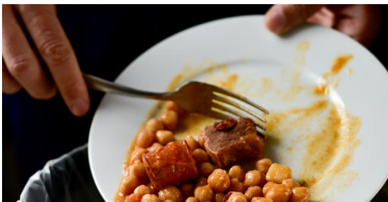
Snížení plýtvání potravinami