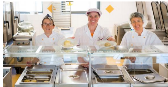
Bezpečnost a hygiena