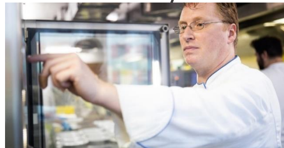
Standardizace a nedostatek kvalifikovaných pracovníků