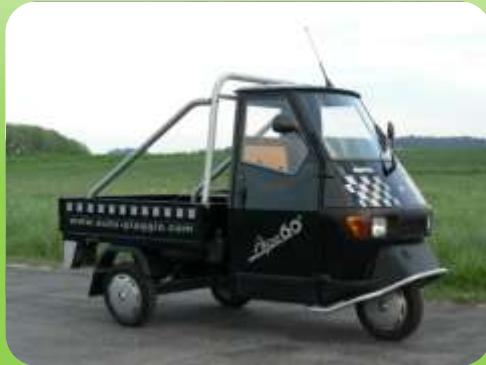
Piaggio Ape 50