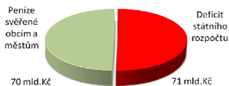
Jak hospodaří stát (plán 2008)?